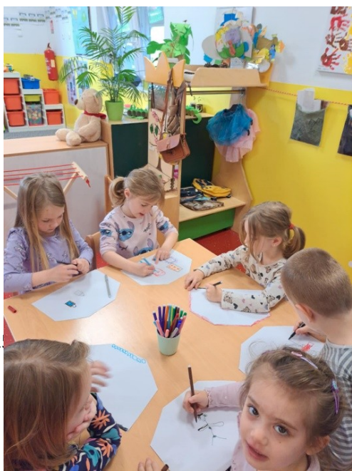
Likovna aktivnost: „U kući gospodina Njokića“