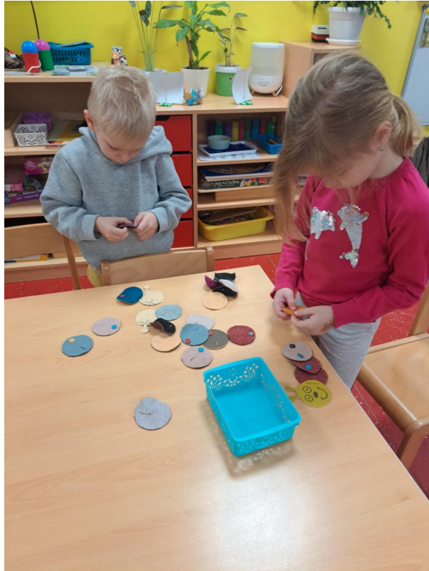
Slagalica: „Od gusjenice do leptira“