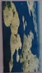
NP KORUNTI 450 KM