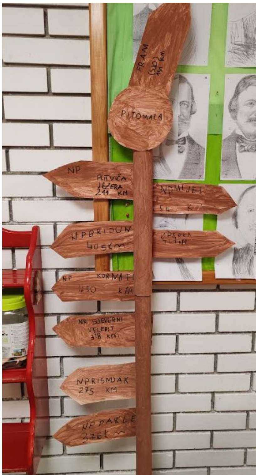
Izlet – posjet parku prirode Papuk (Voćin)