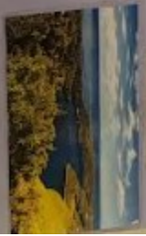
NP MEĐVED 554 KM