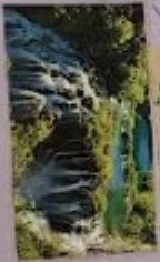
NP DJEČJI JEZERA 214 KM