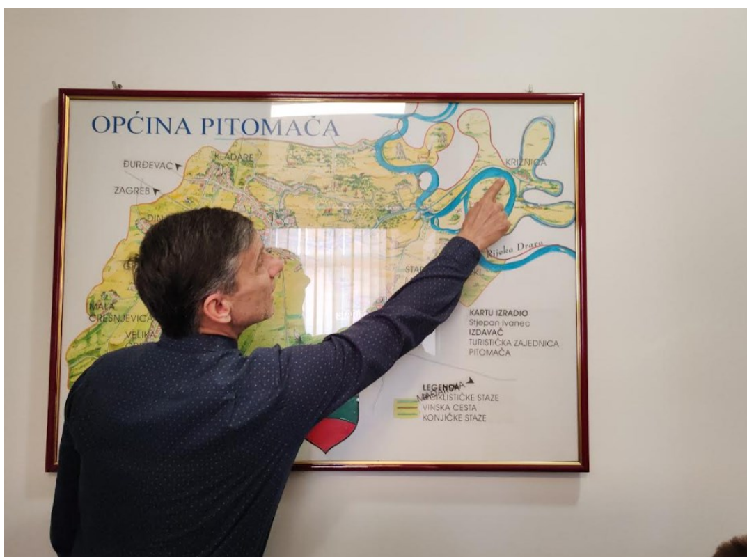
Posjet KUD – a „Marijan Pavleković – Pajo“ iz Otrovanca