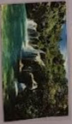
NP KRKA 607 KM