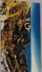
NP DVA OTOKA 376 KM