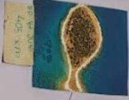
NP VELEBIT 405 KM